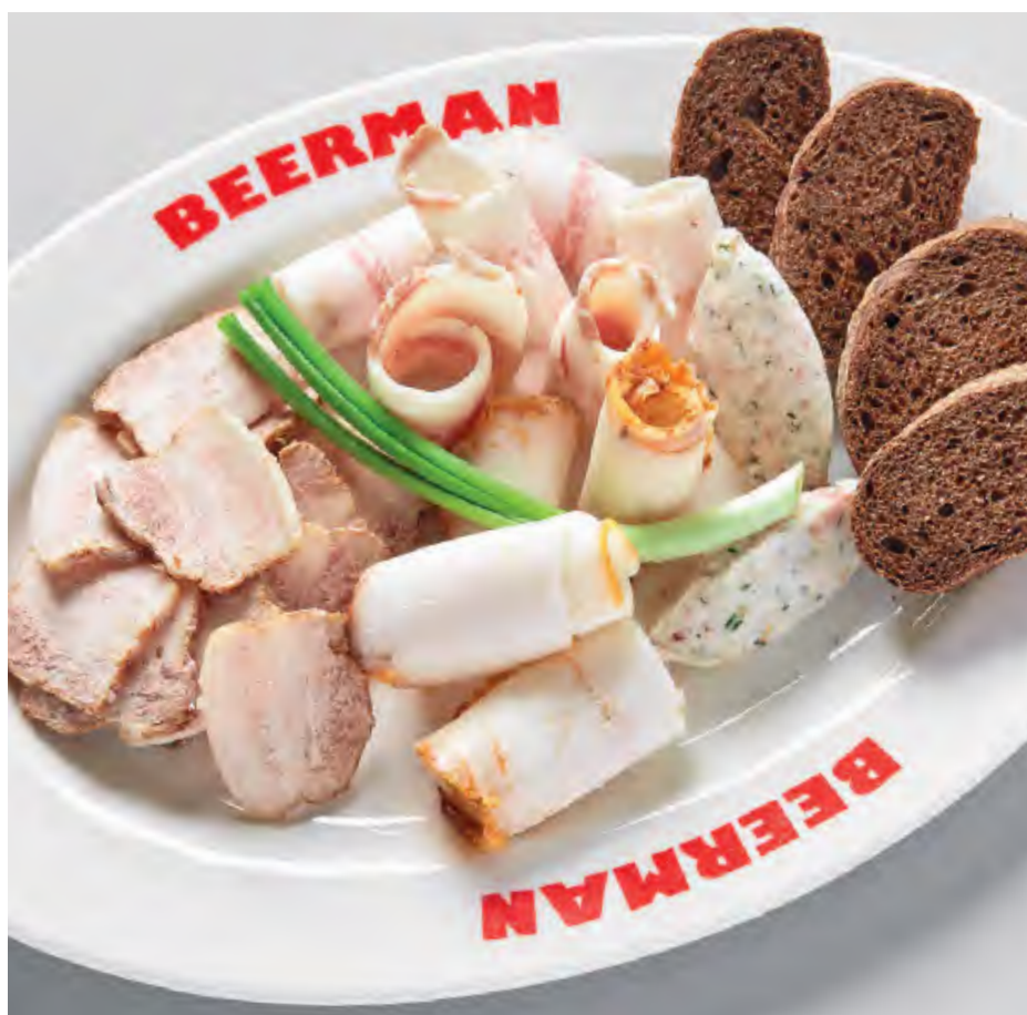
АССОРТИ САЛА 840 / 180/100 г кручёное сало с чесноком, грудинка в соевом соусе, сало соленое, грудинка домашняя