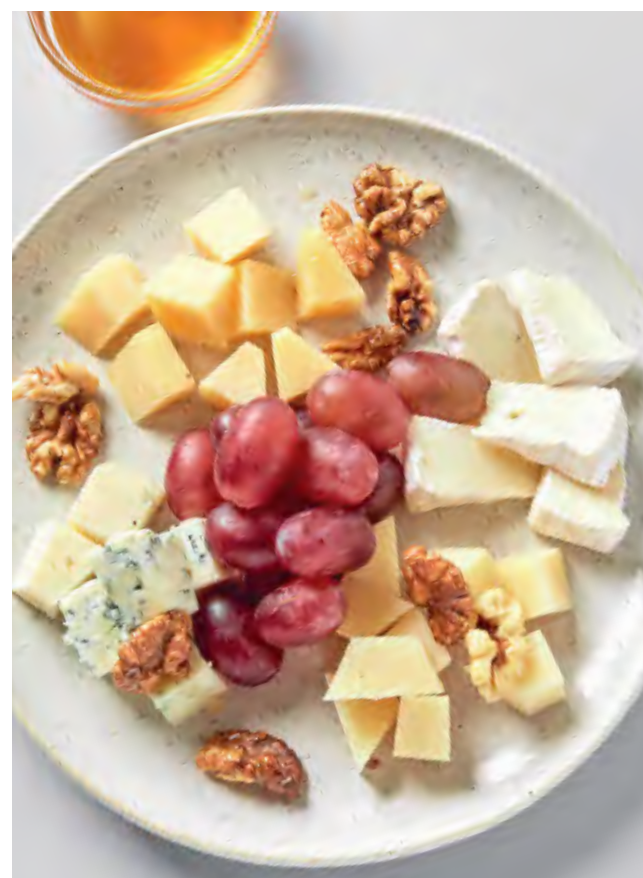
ТАРЕЛКА СЫРОВ 1480 / 160/120 г

лосось домашнего посола, нерка слабой соли, муксун и масляная рыба холодного копчения