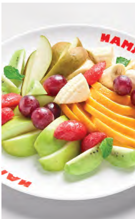
АССОРТИ СЕЗОННЫХ ФРУКТОВ 940 / 400 г

пармезан, горгонзола, камамбер, грюйер с мёдом и грецким орехом