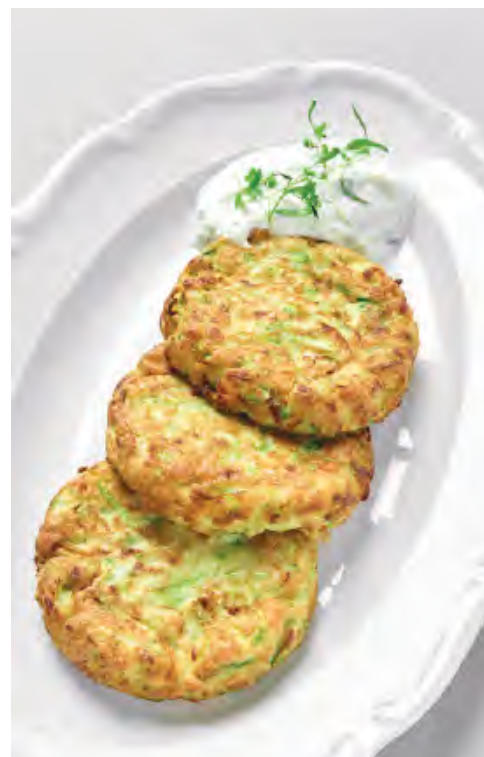
ОЛАДЫ ИЗ КАБАЧКОВ 560 / 150 г