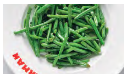
ФАСОЛЬ 440 / 150 г