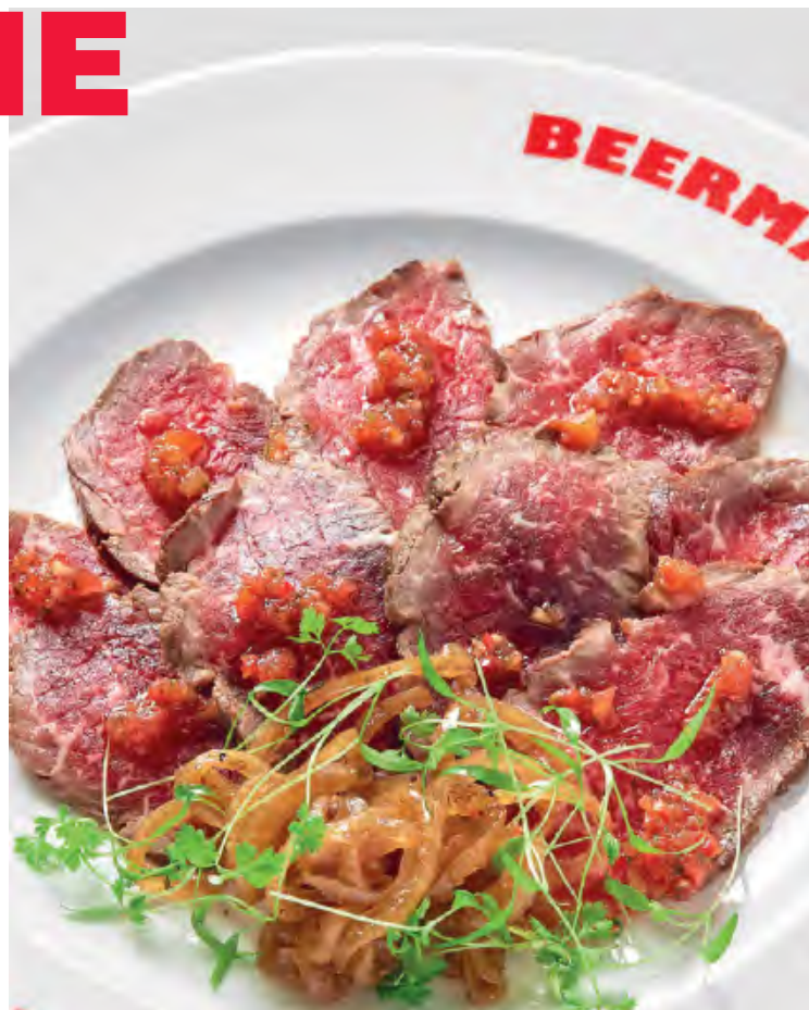
МАРИНОВАННЫЙ РОСТБИФ 1240 / 100 г

из фермерского бычка с маринованным луком и перечной сальсой