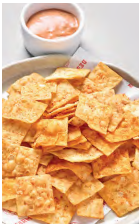
ЧИПСЫ ИЗ ЛАВАША