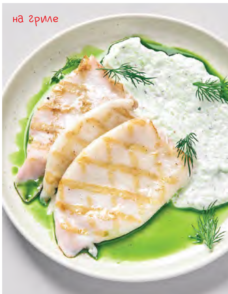
КАЛЬМАР НА ГРИЛЕ