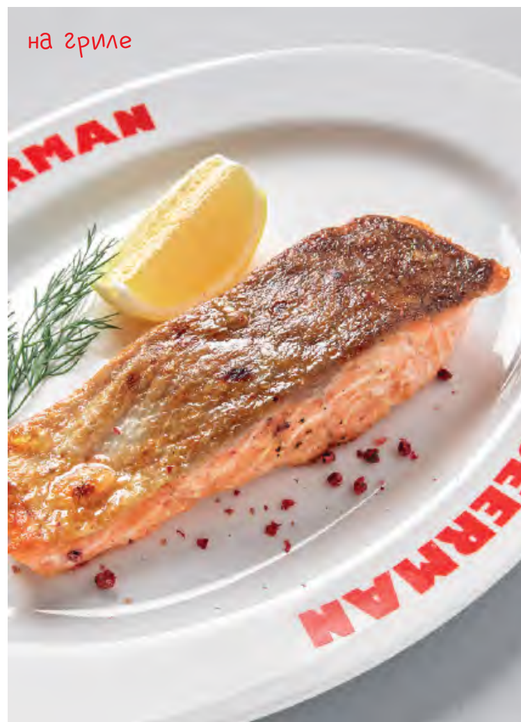
СТЕЙК ИЗ ЛОСОСЯ