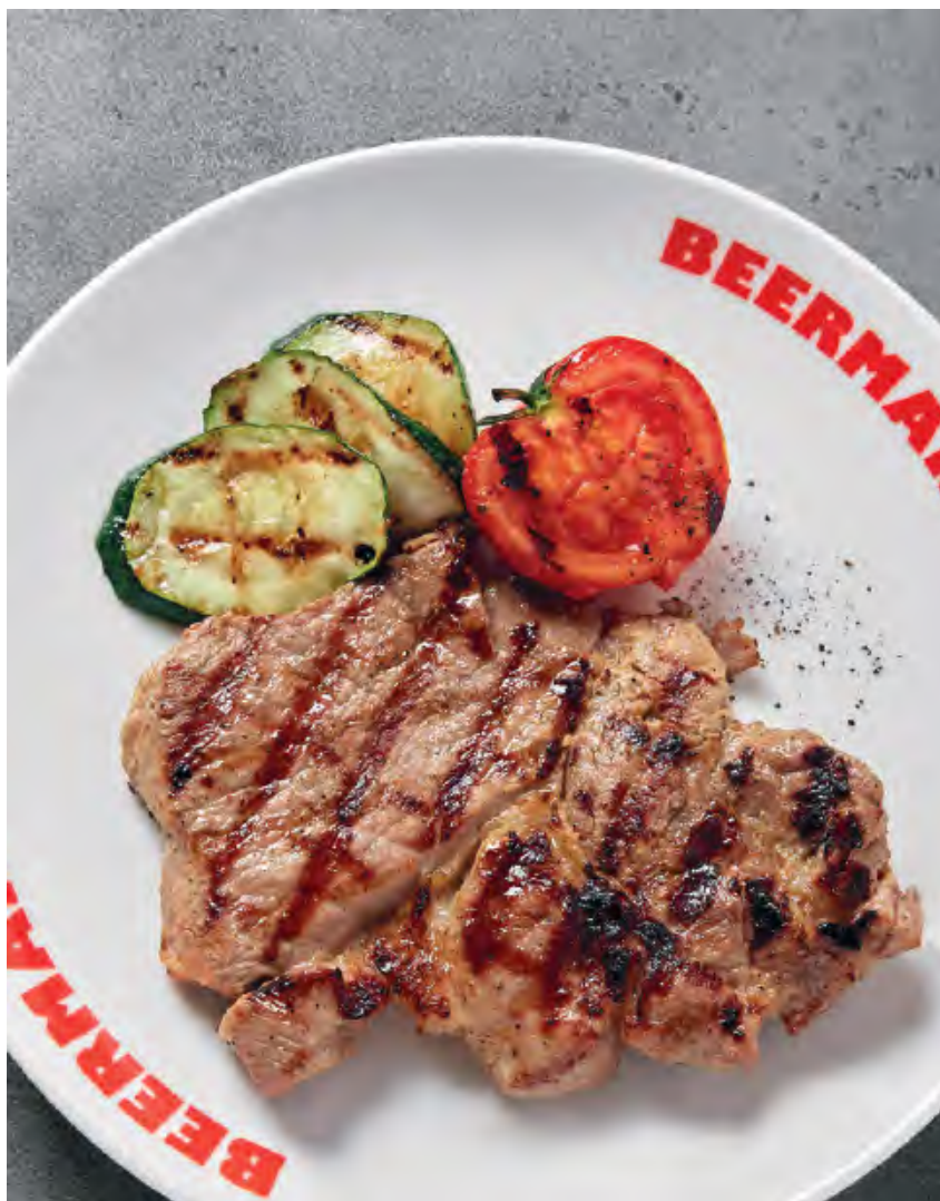
СТЕЙК ИЗ СВИНОЙ ШЕИ на гриле 960 / 200/90 г с печёным томатом и цукини гриль