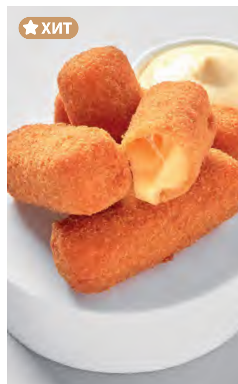
★ ХИТ СЫРНЫЕ ПАЛОЧКИ