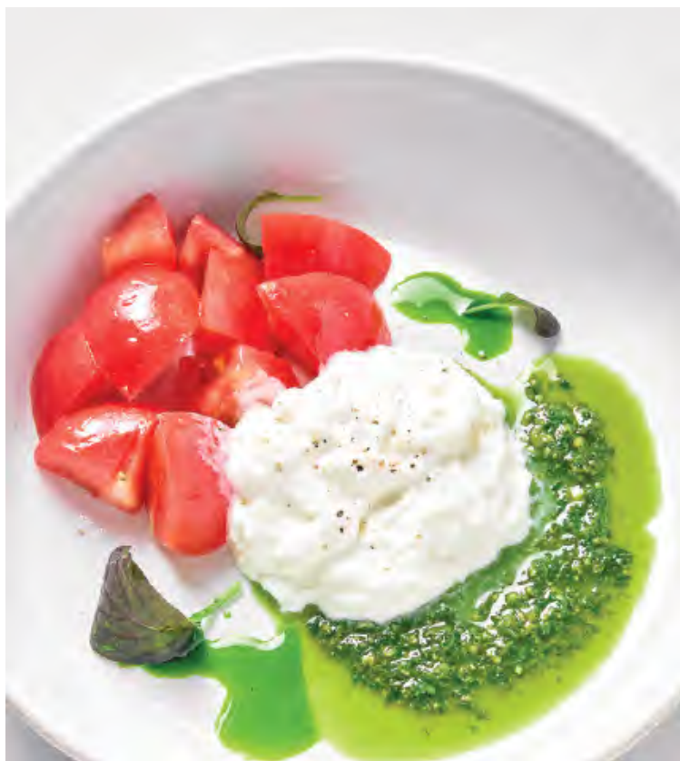
СТРАЧАТЕЛЛА С ТОМАТАМИ 980 / 200 г