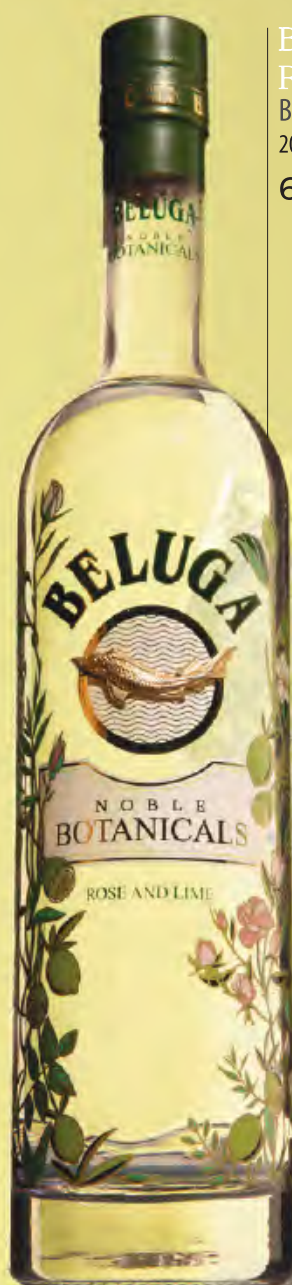
BELUGA BOTANICALS Rose& Tonic Beluga Botanicals Rose, тоник, лайм 200мл 640