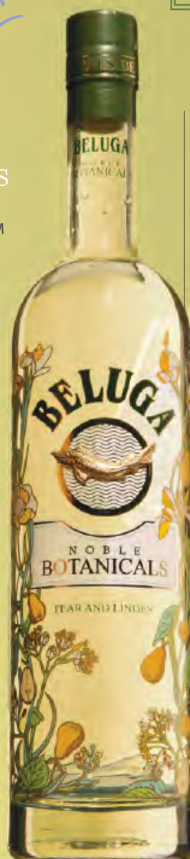
BELUGA BOTANICALS Pear& Tonic Beluga Botanicals Pear, тоник, груша 200мл 640