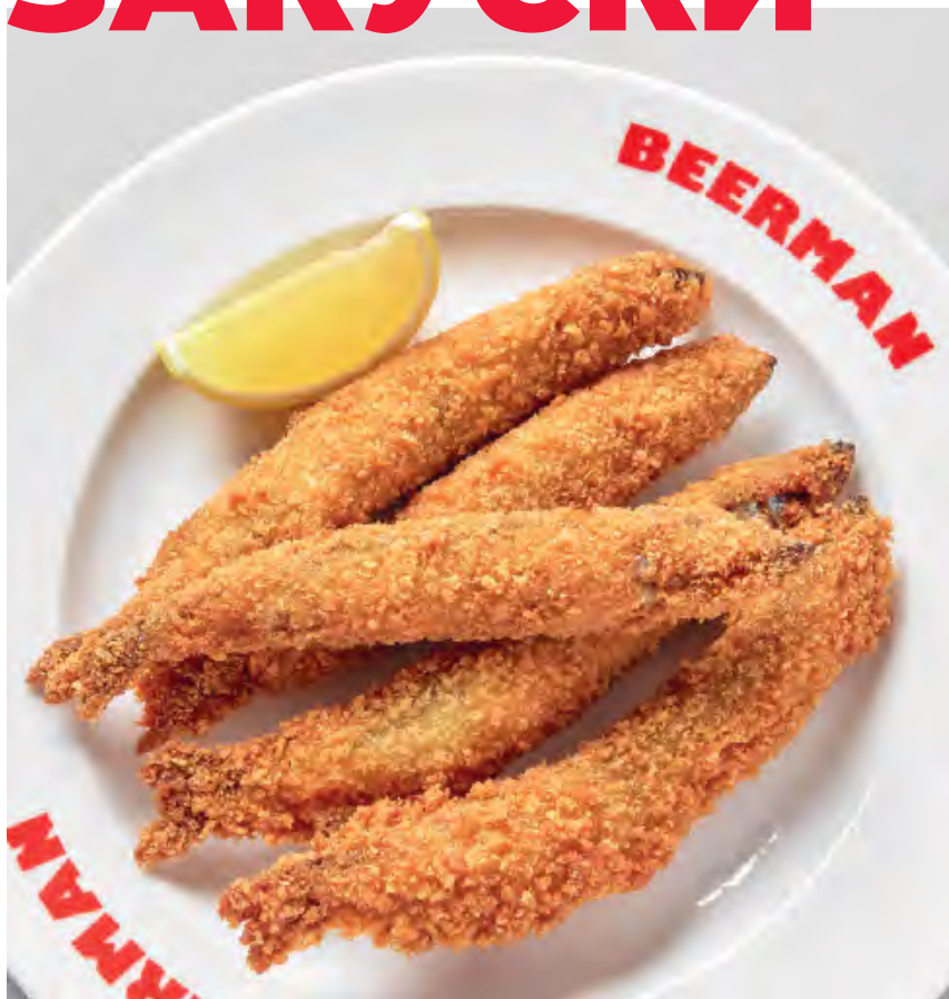
МОЙВА К ПИВУ ★ ХИТ