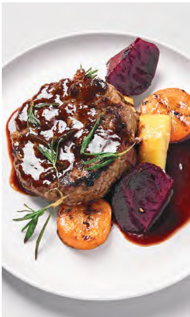
БИФСТЕКС ИЗ МАРАЛА 1460 / 290 г с печёными овощами и ягодным соусом