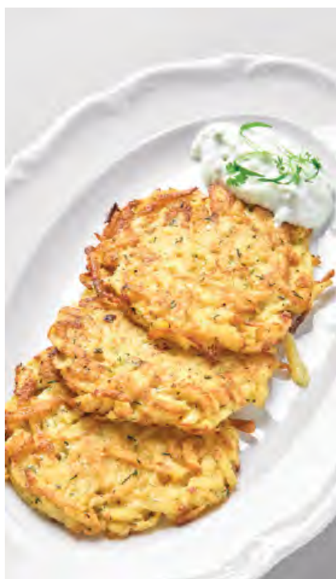
КАРТОФЕЛЬНЫЕ ДРАНИКИ 580 / 150 г