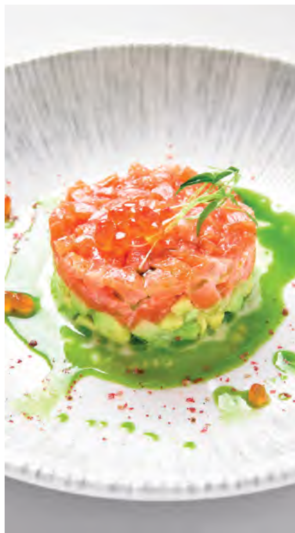
ТАРТАР ИЗ ЛОСОСЯ 1240 / 100 г