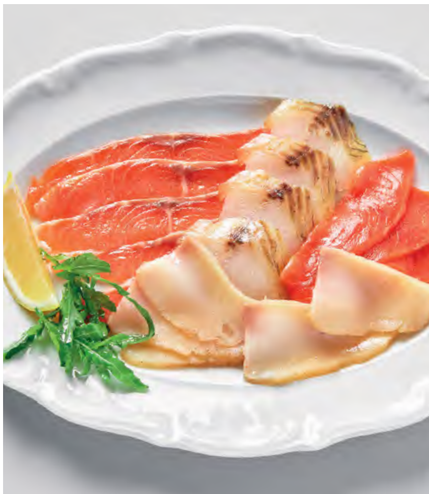
ТАРЕЛКА РЫБНЫХ ДЕЛИКАТЕСОВ 1860 / 190 г

лосось домашнего посола, нерка слабой соли, муксун и масляная рыба холодного копчения