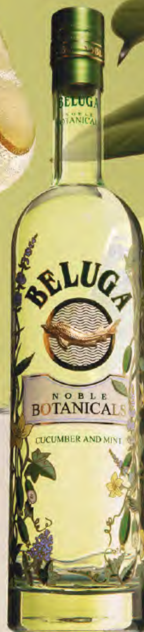
BELUGA BOTANICALS Cucumber& Tonic Beluga Botanicals Cucumber, тоник, огурец 200мл 640

18+ ЧРЕЗМЕРНОЕ УПОТРЕБЛЕНИЕ АЛКОГОЛЯ ВРЕДИТ ВАШЕМУ ЗДОРОВЬЮ