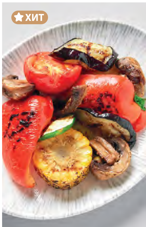
ОВОЩИ ГРИЛЬ 580 / 300 г

помидоры, кабачки, шампиньоны, баклажаны, перец и кукуруза