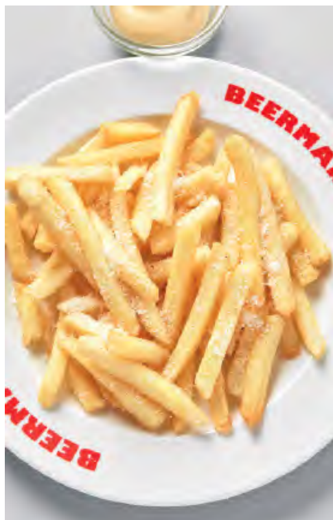
КАРТОФЕЛЬ ФРИ 460 / 150 г

помидоры, кабачки, шампиньоны, баклажаны, перец и кукуруза