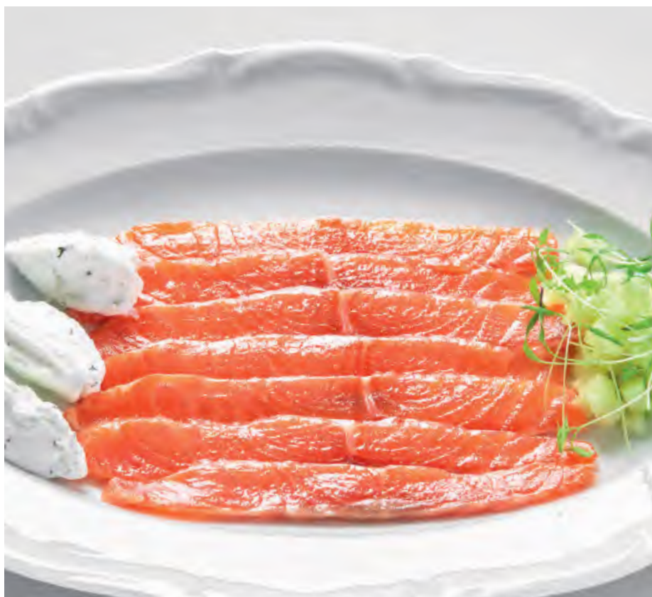
ЛОСОСЬ ДОМАШНЕГО ПОСОЛА

из фермерского бычка с маринованным луком и перечной сальсой